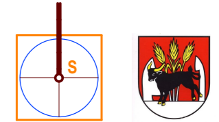
Schéma záväznej časti riešenia M = 1 : 10 000